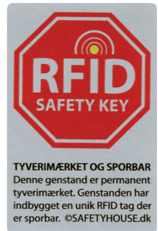
Advarsskilt monteres efterfølgende